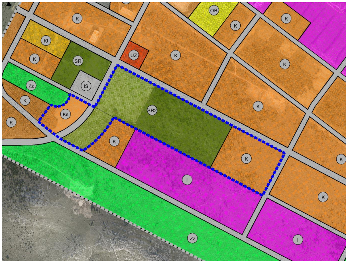
izvadak iz kartografskog prikaza 1. Korištenje i namjena površina - ID UPU gospodarske zone Podi

Zona (Ks) nasuprot zone (SR2) ostaje zona sajmišnog prostora (Ks) no unutar koje se ne planira gradnja. Prostor se može koristiti za izlaganje i prodaju raznovrsne robe te za parkiranje.